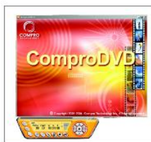
Antar muka aplikasi ComproDVD 2.