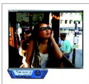
Antar muka aplikasi ComproPVR 2.