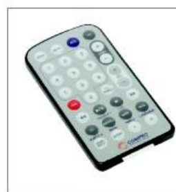
Remote infra merah.